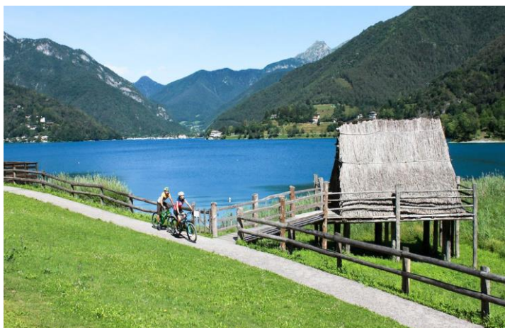
Pista ciclabile Lago di Ledro

La sistemazione sarà presso il Club Hotel di Tenno (3 stelle) fronte lago omonimo in camere doppie (matrimoniale su richiesta al momento della prenotazione), triple o quaduple in base alle disponibilità. Possibilità di partecipare effettuando anche il solo we 20/21 con un solo pernottato. Il costo è di € 60 a persona comprensivo di prima colazione, utilizzo della sauna e della piscina esterna. Le cene saranno al ristorante pizzeria adiacente con sconto 20% a noi riservato in quanto ospiti dell'albergo. A disposizione un garage per le bikes.