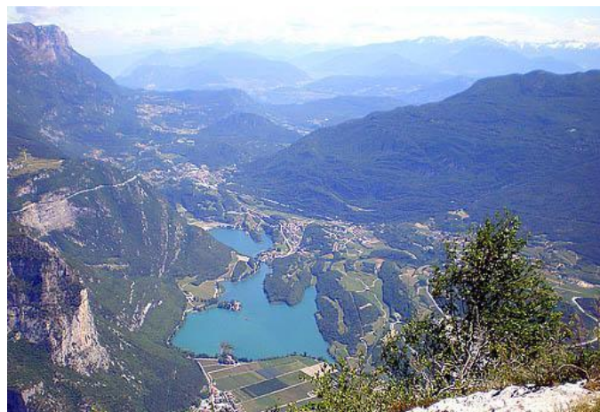
Lago di Toblino e S. Massenza